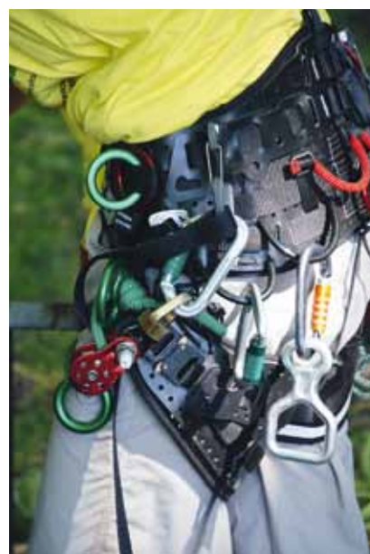
La sécurité des arboristes-grimpeurs est liée à la qualité du matériel utilisé.

Attention: pour participer à cette session, il est nécessaire d'avoir pratiqué au minimum deux ans de travaux spécifiques liés aux arbres. Un livre-journal est exigé lors de la demande pour l'inscription aux examens. Un formulaire ad hoc ainsi qu'une liste des travaux «Justificatifs de travail pratique pour l'admission à l'examen pour spécialistes en soins aux arbres avec brevet fédéral» sont disponibles pour aider les candidats dans leurs démarches. Il est important pour les personnes intéressées de commencer